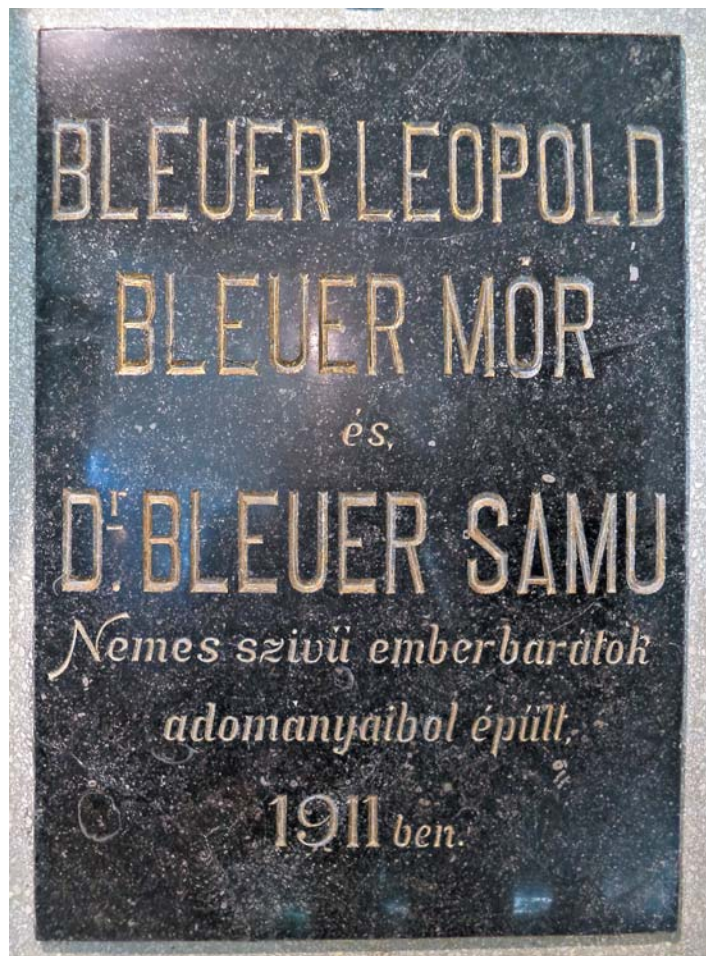
Az emléktábla, amely az azóta elbontott óvoda falán állt

Ibrányban mintaszerű jelenség volt, ahogyan a keresztény és a zsidó közösség együtt, egymást segítve élt. Mint fentebb láttuk, Bleuer Mór felekezetre való tekintet nélkül támogatta a falu szegényeit, iskoláit, óvodáit. A hála azonban nem maradt el a falu részéről sem, ezt bizonyítja egy szép történet. Az ibrány zsidó hitközség 1893-ban elhatározta, hogy templomot épít. Önerőből